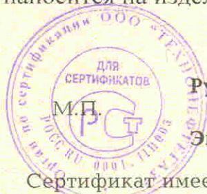
Схема сертификации – 6

наносится на изделие и в сопроводительных технических документах.