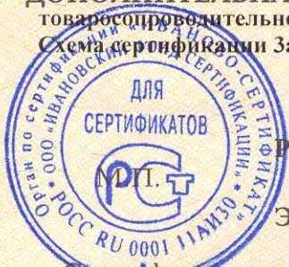
Схема сертификации За.

ДОПОЛНИТЕЛЬНАЯ ИНФОРМАЦИЯ Место нанесения знака соответствия: на изделии и в товаросопроводительной документации.